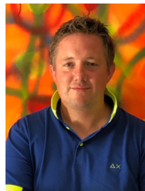
DEMOOR QUIÉRIEN P.5